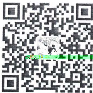
农业银行信用卡微信服务号

卡”——“申请进度查询”；或者“农业银行信用卡”微信小程序，选择“信用卡申请—申请进度查询”。